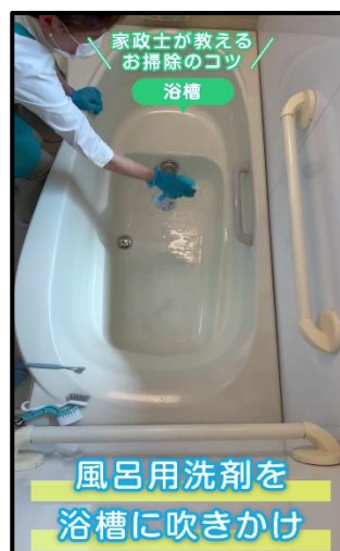
ユーチューブ動画