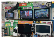
モニター付き防犯カメラ

録画は、SDカードなどカード類に記憶するタイプが多いのですが、中にはクラウドシステムを導入しているものもあり、インターネットに接続してクラウド上で映像を保存できます。ただし、このタイプは月々のクラウド利用料金がかります。