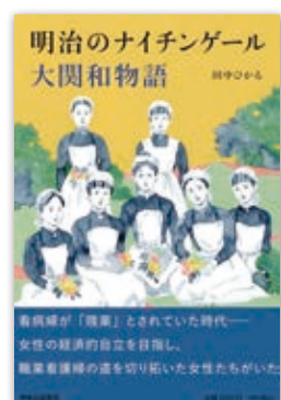
▲『明治のナイチンゲール 大関和物語』 著者:田中ひかる 出版社:中央公論新社 ¥2,530

私がケア労働の社会化に興味を持ったのは、女性のキャリアをこの30年テーマにしてきたからです。「女性活躍推進」という言葉にアレルギーをもたれる方もいると思うんですが、私は少しゆるく捉え、働きたい女性とそのチャンスを得られるような環境作りをしましょう、という意味で肯定的に捉えています。2010年代第2次安倍政権の時に、女性活躍推進という言葉が声高に言われるようになりましたが、そこで進んだことは、家事・育児・介護の負担は変わらず、女性にもっと仕事をというダブルワークどころかトリプルワークの推進で、女性は職場がチャンスをくれるといっても、もうこれ以上もう働けないですと悲鳴を