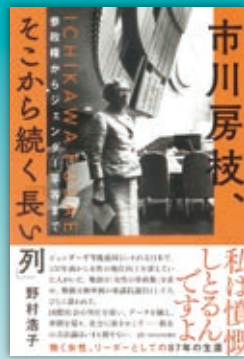
▲『市川房枝、そこから続く「長い列」 参政権からジェンダー平等まで』 著者：野村 浩子 出版社：亜紀書房 ¥2,200