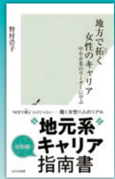
▲『地方で拓く女性のキャリア 中小企業のリーダーに学ぶ』 著者：野村 浩子 出版社：光文社 ¥1,078